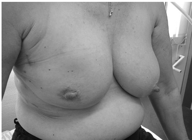
Fig. 4. Paciente con una gran tumoración en cuadrantes externos de mama derecha, se practicó resección completa subcutánea de la mama y reconstrucción con material protésico cubierto con músculo.

En los casos en que se ha realizado una mastectomía conservadora de piel que incluya el complejo aréola-pezón, se puede cerrar simplemente la incisión periareolar mediante un punto en bolsa de tabaco, sin peligro alguno de extrusión protésica, ya que debajo tenemos plano muscular. La intervención finaliza con la colocación de drenajes aspirativos tanto en el lecho dorsal como en el de la mastectomía. La duración del procedimiento es de alrededor de 3 h.