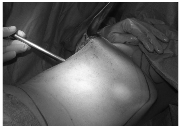
Fig. 2. Cámara de laparoscopia introducida en el lecho quirúrgico que permite apreciar la distancia a la cual se secciona el gran dorsal, la luz que proporciona es imprescindible para la intervención.